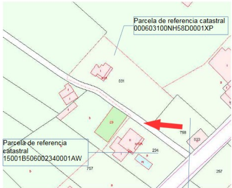
Plano de catastro

que por el sur linda con dicha finca matriz, y destinarse a camino o vía pública para servicio de